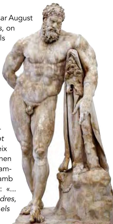
ESTÀTUA D'HERAKLES FARNESIO, UN HEROI CONSIDERAT GEGANT A LA MITOLOGIA GREGA.

ca daurada), el qual pren la redacció que Cèsar August feu en la crònica de la Guerra de les Gal·lies , on descriu costums dels celtes que habitaven els territoris que més endavant serien Bèlgica, França i part de l'actual Alemanya i alta Itàlia, les Gal·lies (bona part de l'actual Europa), costums que poden interessar-nos pel nostre treball. Diu Cèsar que aquests gals « Construïen colossals imatges de cistelleria o de fusta i herba, que omplien amb homes vius, bestiar o animals d'altres menes (malefactors, presoners o simplement bèsties); després hi botaven foc, i calaven amb tot el seu contingut vivent ». Si tal com ell mateix suggereix aquestes "gegants" dels gals, tenen relació amb els "gegants londinencs" que també extreu de vells documents, i emparenta amb les actuals figures dels gegants europeus: «... durant les vacances solsticials d'estiu a Londres, allò que fa meravellar la gent és quan surten els immensos i deformes gegants marxant com si fossin vius i armats de punta en blanc, però farcits el seu interior amb paper d'estrassa i estopes, fins que la canalla, entremaliats, espion per sota les figures i descobreixen la superxeria, convertint-se llavors en la més gran irrisió ».