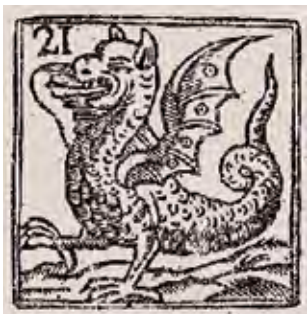
DRAC SEGONS UNA IMATGE D'UN VENTALL VUITCENTISTA.

en nous elements, tant de gegants i capgrossos com de bestiari festiu. Aquesta informació es pot anar resseguint fàcilment a les xarxes. De forma paral·lela van augmentant els espais d'exhibició dels elements festius (trobades, aplecs, corre-focs), més enllà de la festa major que, habitualment, n'era el seu origen.