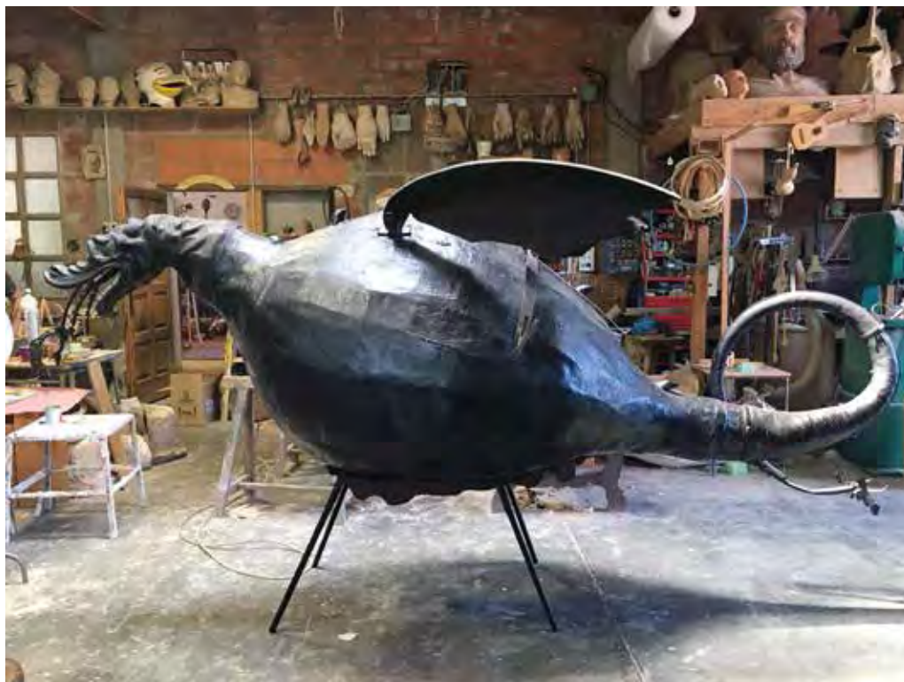
RÈPLICA DEL DRAC DE LA BISBAL DE L'EMPORDÀ, DATAT DEL SEGLE XVII. TALLER VENTURA&HOSTA (1995).

convertit ja en peça de museu i està exposada en algun local. Aquest perfil encara està actiu en algunes creacions recents.