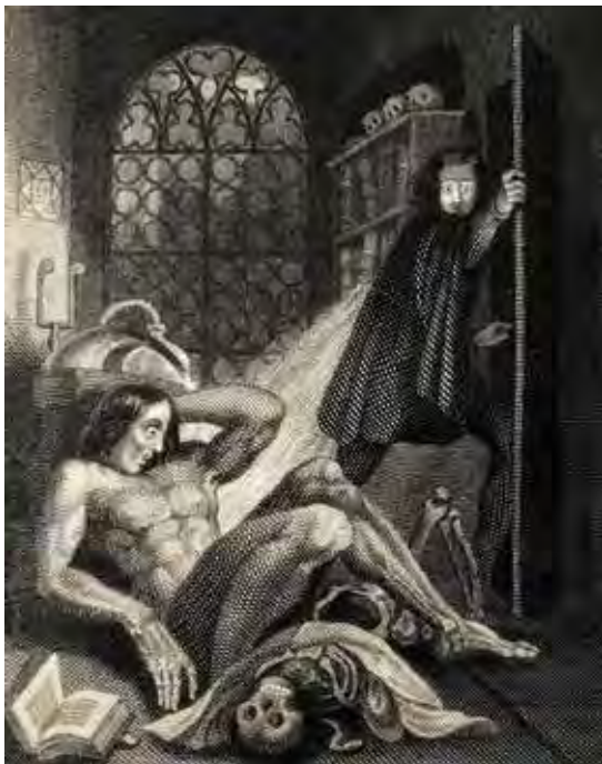
DIBUIX DE LA PORTADA DE LA PRIMERA EDICIÓ DEL LLIBRE FRANKENSTEIN , DE MARY WOLLSTONECRAFT SHELLEY (1818).

d'estranyar tant aquest procés, recordem que els precedents d'aquests cicle va inaugurar-los el segle XVIII, amb el romanticisme, que formulà una nova ciència, el folklore, una nova ciència que reivindicava l'estudi dels vells costums i les velles identitats europees, i que sovint en postulava el seu retorn. Altrament, aquest segle XVIII del romanticisme, cal tenir-ho molt en compte, s'obre amb l'edició del Frankenstein , de Mary Wollstonecraft Shelley , una novel·la que al capdavant és la reedició del mite del nou home, el Prometeu d'Hesíode, un fill dels titans. I amb la redescoberta de l'home nou, o l'home construït (l'ésser artificial del doctor Frankens-