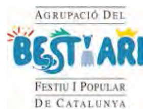
LOGOTIP DE L'AGRUPACIÓ DEL BESTIARI FESTIU I POPULAR DE CATALUNYA.

Darrera de totes aquestes figures hi ha una entitat, colla o institució que agrupa a molta gent que fa ballar les peces i té cura del seu manteniment. Cal afegir, a més que cada any es cre-