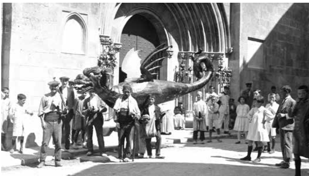
DRAC DE VILAFRANCA EN UNA FOTO DE FINALS DEL SEGLE XIX.

La força i la vida social que genera tot aquest moviment pivota sobre la figura festiva, ja sigui gegant, drac, mulassa, mussol, porc senglar, ocell, peix, insecte, monstre o figura mitològica. I darrera la figura s'amaga el seu creador que en aquest llibre s'anomena escultor de la festa . Qui són els escultors de la festa? Els creadors d'aquestes figures que es converteixen en veritables tòtems moderns de les comunitats que les encarreguen. Fem una mica d'història. Sabem que al segle XIV, i segurament abans, ja desfilaven gegants i bestiari a la festa del Corpus a Catalunya i posteriorment, amb alts i baixos, la tradició de la imatgeria a les festes s'ha mantingut fins l'actualitat. Possiblement els primers constructors d'imatgeria eren escultors que ja deuriem tenir pràctica en testes de persones al modelar sants i en testes de dracs o altres bèsties al modelar gàrgoles. No tenim constància de cap