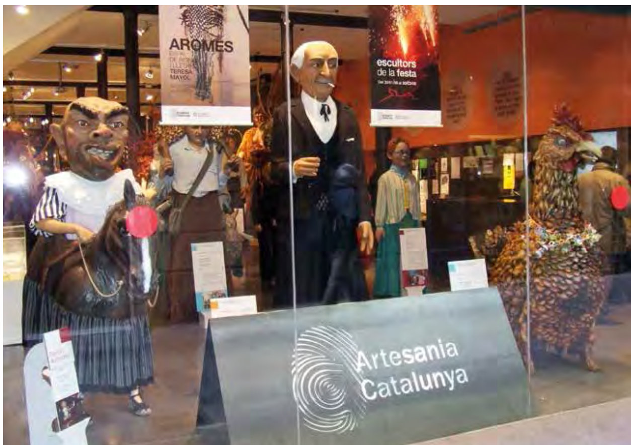
APARADOR DE L'EXPOSICIÓ ESCULTORS DE LA FESTA AL CENTRE D'ARTESANIA DE BARCELONA. A L'ESQUERRA EL BITLLO DE GRANOLLERS (TALLER SARANDACA), AL CENTRE L'AVI HOSTA (TALLER VENTURA&HOSTA) I A LA DRETA LA GALLINA BALLARICA (TALLER DOLORS SANS).

imatgeria, no és fins al darrer terç del segle xx quan trobem professionals dedicats quasi exclusivament a crear aquestes figures i a poder-ne viure i consolidar la seva activitat com una professió especialitzada.