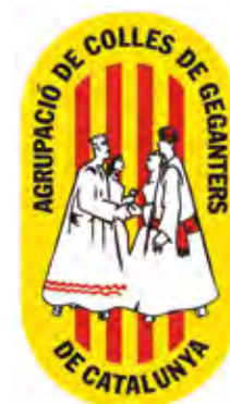
LOGOTIP DE L'AGRUPACIÓ DE COLLES DE GEGANTERS DE CATALUNYA.