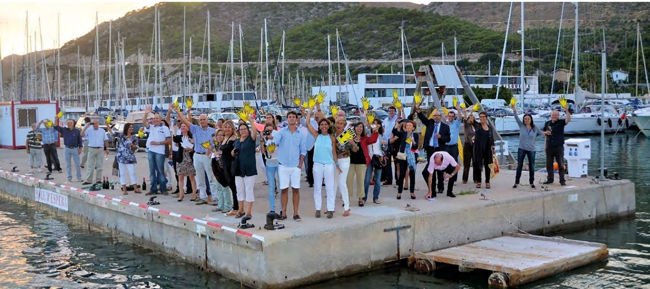
Pantalà de Port Ginesta. És l'hora dels adéus.