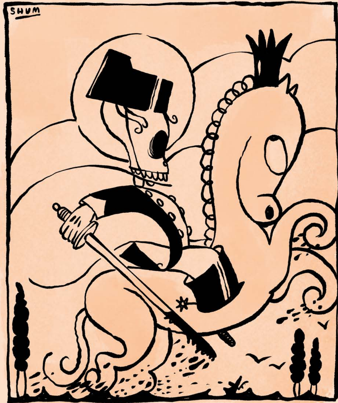
SAN GUARDIA CIVIL PATRON DE ESPAÑA

ENCARA NO HO SABIEM, PERÒ ELL HAVIA DE DIBUIXAR-LOS REPETIDAMENT, RIDICULTZANT-LOS ... PERÒ NO VULL AVANÇAR ESDEVENIMENTS. EN AQUELL MOMENT NOMES VAIG TENIR CLAR QUE... CALIA AJUDAR-LO!