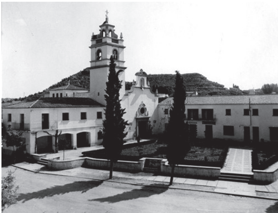
Plaça del poble de Sucs. Commemoración del XXV aniversario de la fundación del Instituto Nacional de Colonización. Ministeri d'Agricultura, 1964.