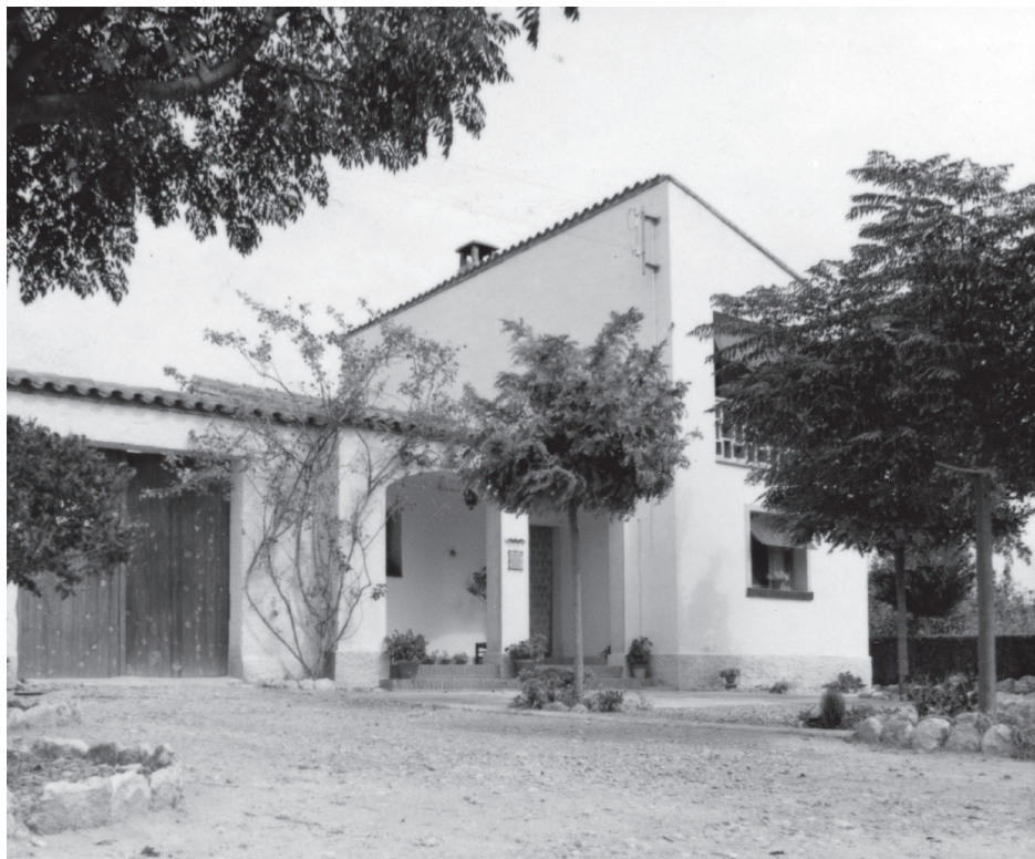
Habitatge pilot de Sucs. Commemoración del XXV aniversario de la fundación del Instituto Nacional de Colonización. Ministeri d'Agricultura, 1964.