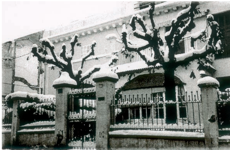
La casa dels meus pares al carrer la Premsa de Lleida.

La casa on vivíem era molt gran i donava molt