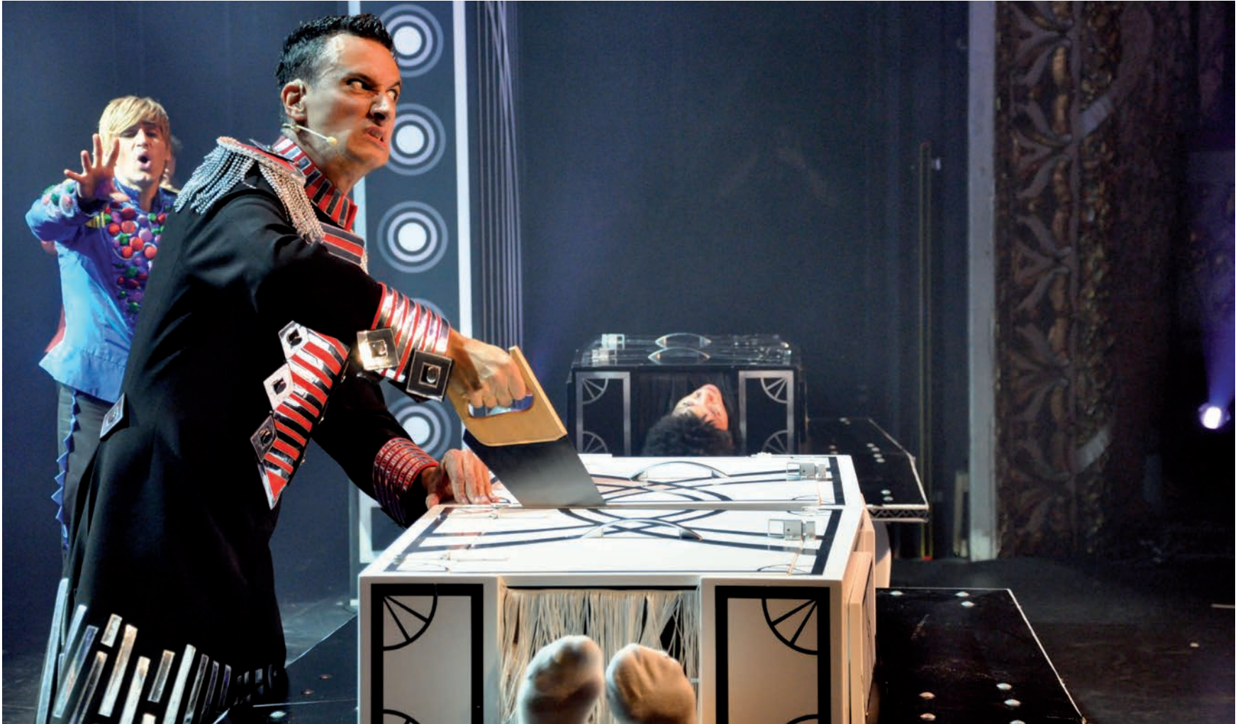
↑ Blanc o negre. Un sanguinari Mag Lari talla per la meitat un dels seus ajudants davant de la cara d'angúnia dels altres.