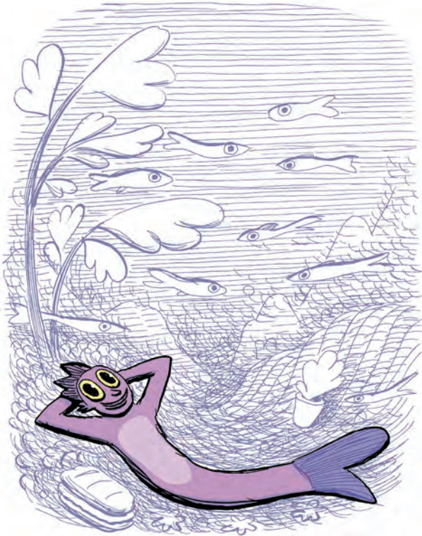
En Marí en el moment que va tenir la idea.