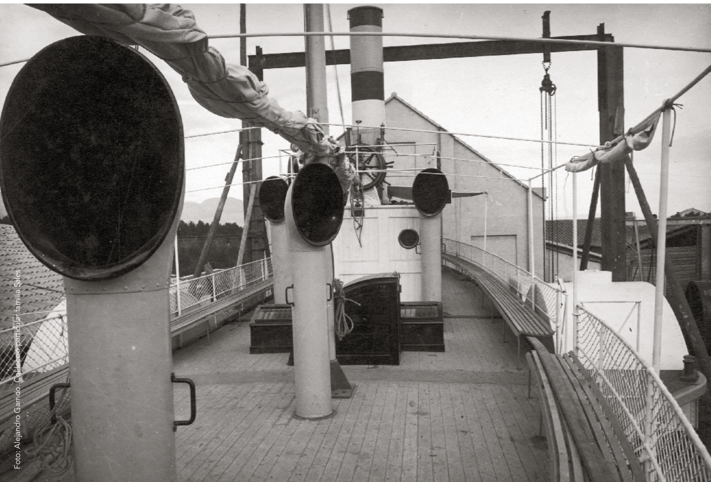
Coberta del vapor Anita .