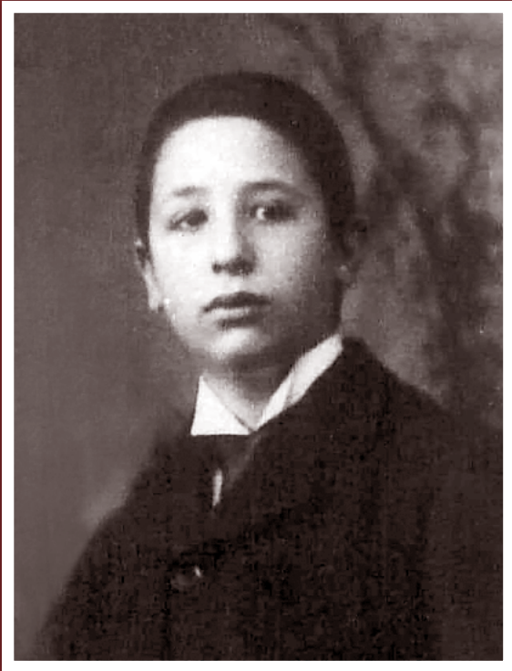
Lluís Companys.