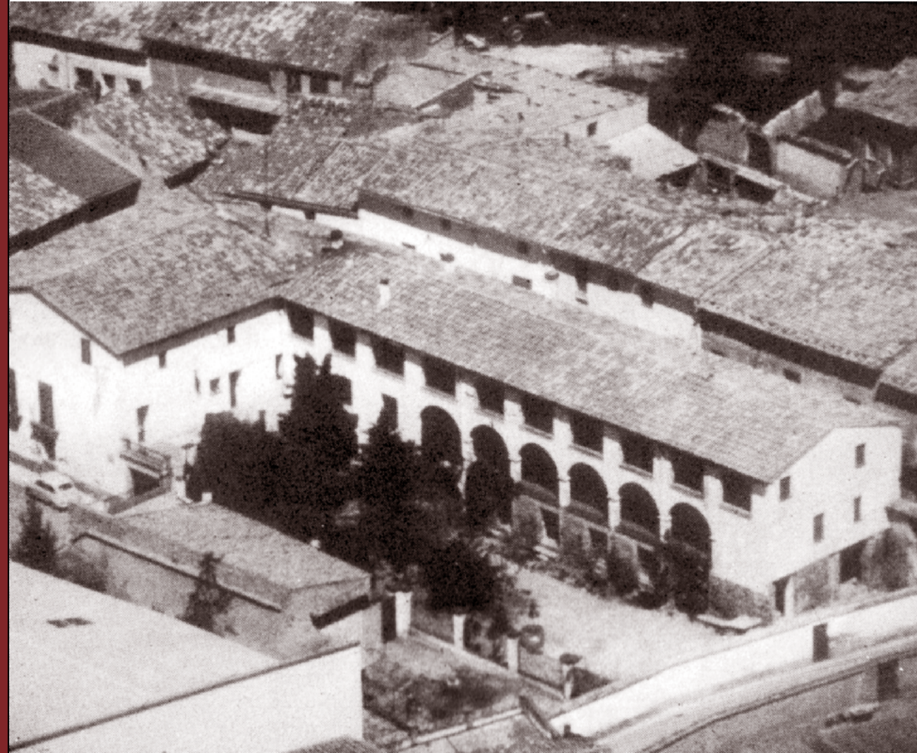
Casa pairal dels Companys al Tarròs (Urgell).